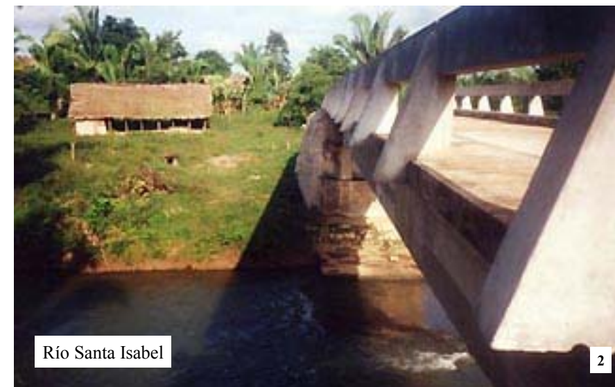
Río Santa Isabel